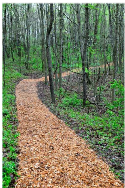
ösvény faapírtékkal, szegély nélkül