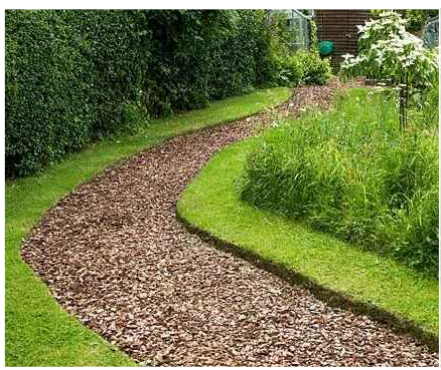
ösvény faapírtékkal, szegéllyel