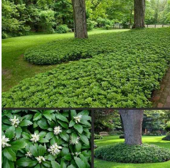
árnyéki aljnövényzet jellegű ágyások